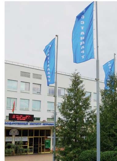
THE STATE COMMITTEE FOR STANDARDIZATION OF THE REPUBLIC OF BELARUS

I hope that the success of our enterprises will continue to promote the development of the domestic market of innovative, high-quality and safe products, strengthen technological sovereignty, give Belarusians a reason to be proud of their country, make it richer and stronger!