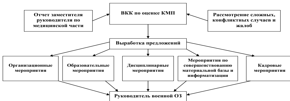
Рисунок 3 – Алгоритм работы ВКК по оценке КМП

ВКК по оценке КМП, руководствуясь комплексом организационно-методологических принципов, ежеквартально проводит анализ выявленных недостатков, оценку КМП в наиболее сложных и конфликтных ситуациях, требующих комиссионного рассмотрения, и формирует предложения (программу) по совершенствованию КМП (рисунок 3).