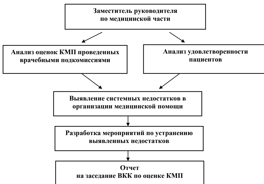
Рисунок 2 – Алгоритм осуществления оценки КМП заместителем начальника военной ОЗ (ВМЦ) по медицинской части

ВКК по оценке КМП, руководствуясь комплексом организационно-методологических принципов, ежеквартально проводит анализ выявленных недостатков, оценку КМП в наиболее сложных и конфликтных ситуациях, требующих комиссионного рассмотрения, и формирует предложения (программу) по совершенствованию КМП (рисунок 3).