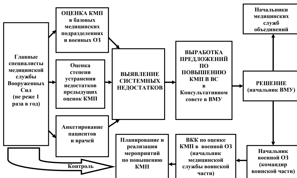
Рисунок 5 – Алгоритм проведения второго уровня оценки КМП

Устранение выявленных недостатков при оказании медицинской помощи и совершенствование КМП в ВС контролируют главные специалисты медицинской службы (рисунок 5).