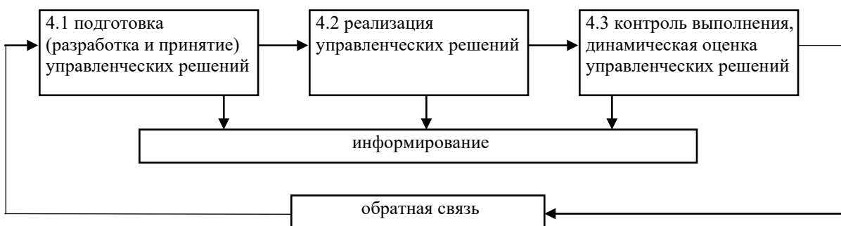
Рисунок 1 – Система управления качеством медицинской деятельности