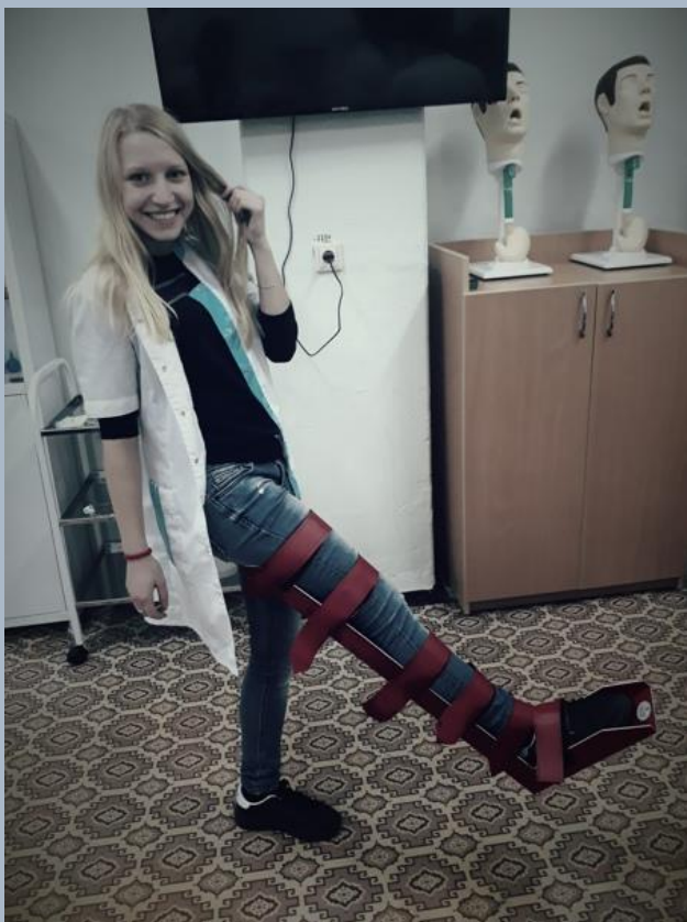
1 курс. Первая помощь

Если бы Вас попросили показать одну фотографию за все время обучения, то какая бы это была фотография?