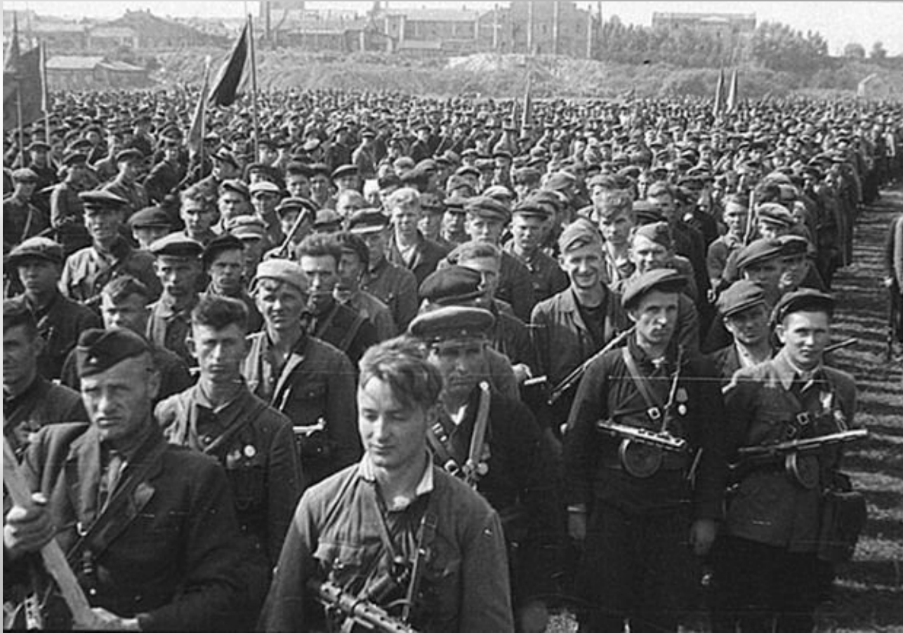
Партизанские бригады на параде в Минске