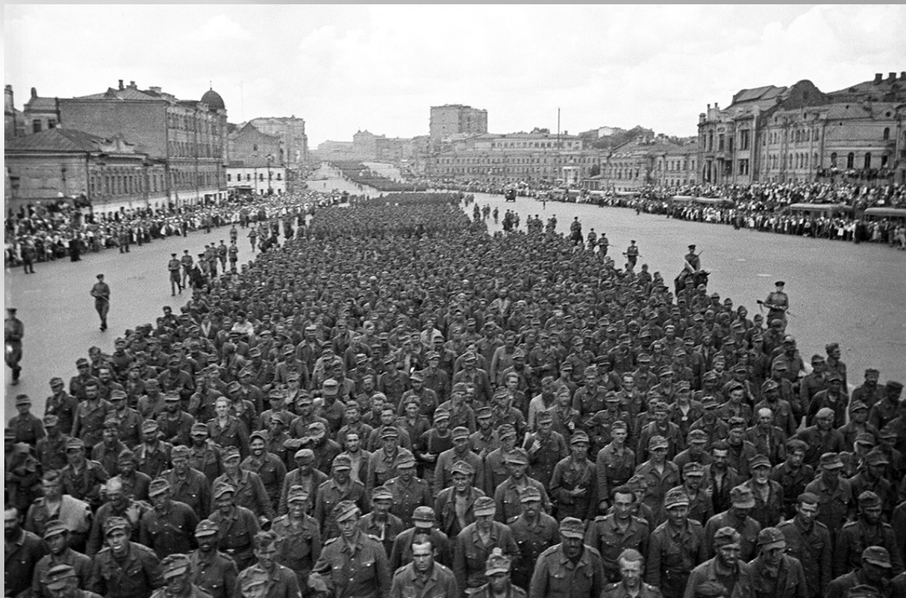
Марш пленных немцев в Москве 17 июля 1944 года