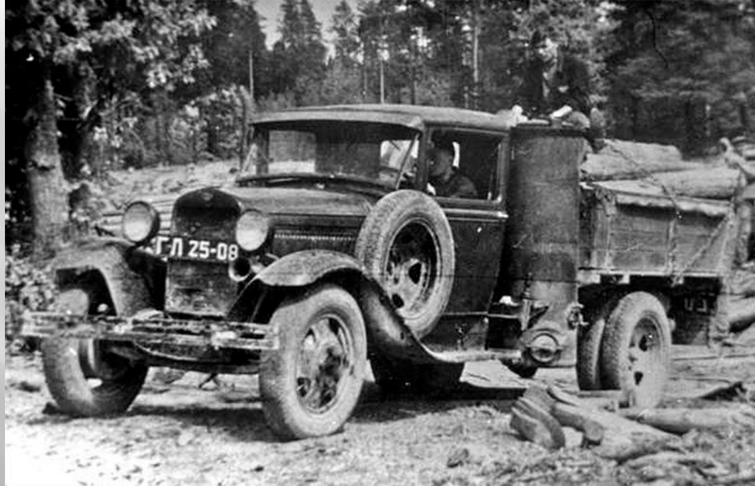
Тот самый газогенераторный ЗИС-21

В параде принимала участие и техника – трофейная немецкая самоходка «Мардер», в колонне бригады имени Калинина ехал автомобиль ЗИС-21 с газогенераторным двигателем способным работать на дровах.