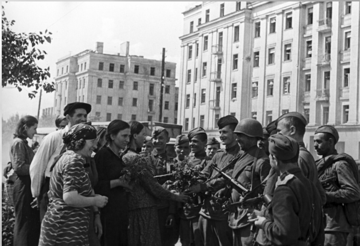
Жители Минска встречают воинов 2-го Белорусского фронта