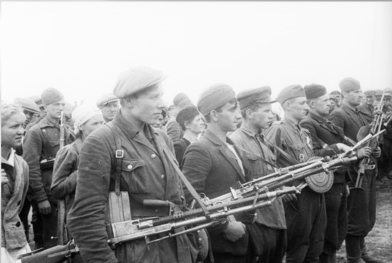
Партизаны со своими трофеями на параде в Минске