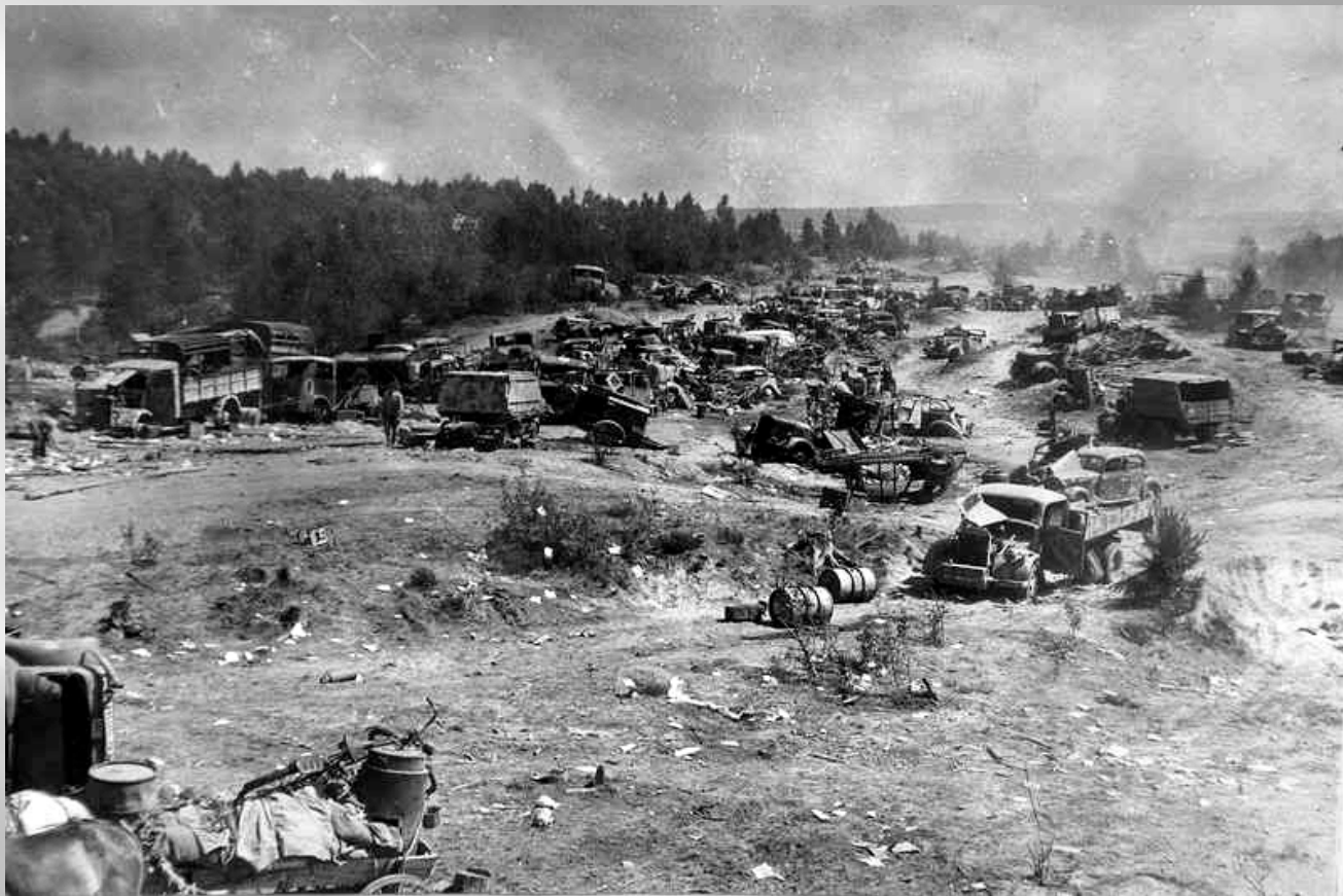
Колонна 9-й немецкой армии разгромлена ударом с воздуха неподалеку от Бобруйска