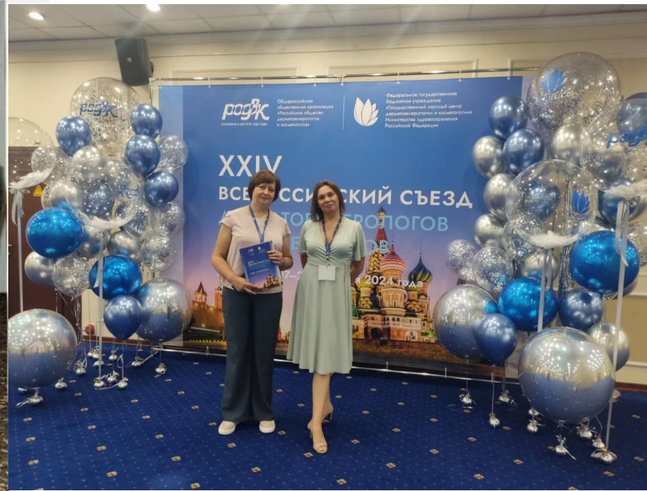
На Всероссийском съезде дерматовенерологов в Москве, Российская Федерация