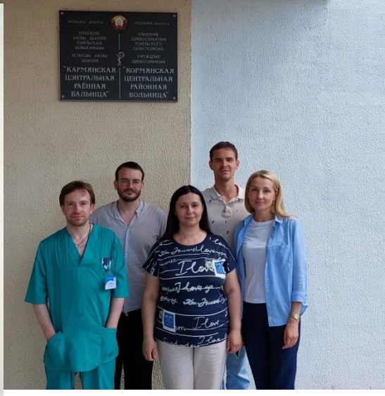
Консультативный выезд В Кормяную ЦРБ