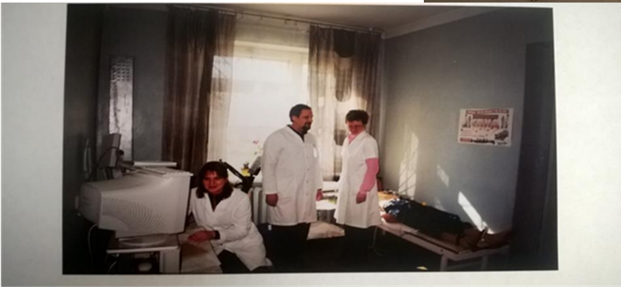
Выезд в Хойникскую ЦРБ для проведения комплексного профилактического осмотра работников Полесского радиационно-экологического заповедника