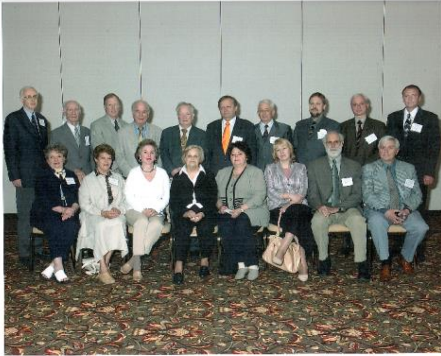
Международная группа независимых экспертов БелАМ-проекта в Национальном институте рака, Бетезда, США