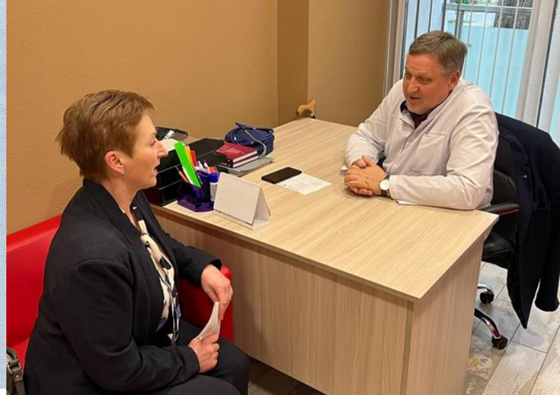
Выездная консультация в санатории «Машиностроитель»