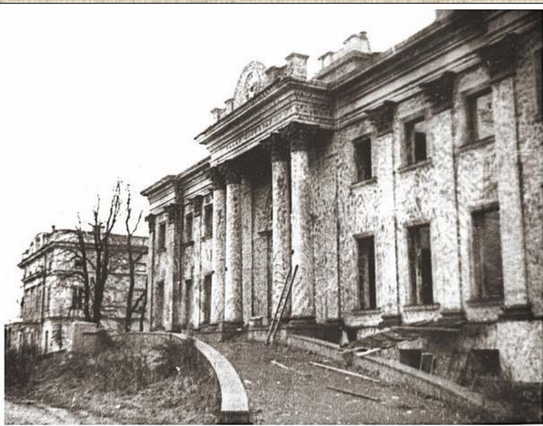
Соженный дворец Румянцевых и Паскевичей

21 сентября 1943 года в оперативной сводке Совинформбюро появилось сообщение о Гомельском направлении. Успешное форсирование Днепра и Сожа, освобождение Комарина, Тереховки, Ветки, Добруша, Новобелицы, Лоева, позволили советским войскам начать непосредственную подготовку к решительным боям за областной центр, которые вошли в историю Великой Отечественной войны под названием Гомельско-Речицкой операции .