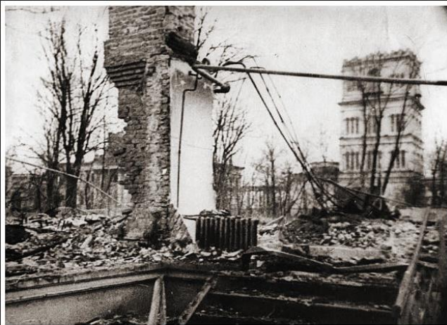
Парк культуры и отдыха имени А.В. Луначарского. Гомель