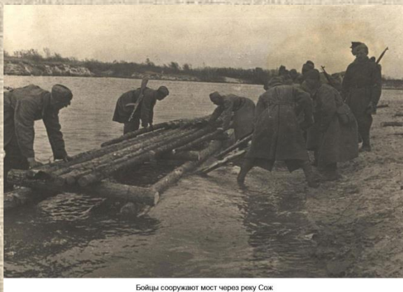
Бойцы сооружают мост через реку Сож.