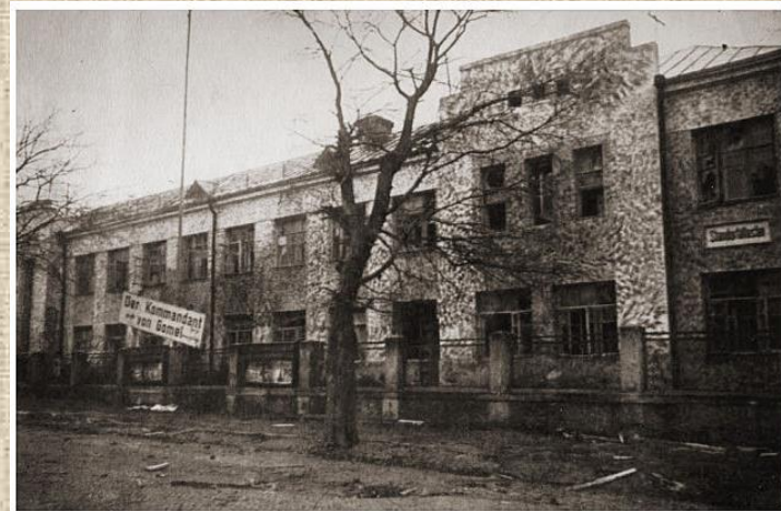
Здание фашистской комендатуры, находившееся в г. Гомеле во время оккупации по ул. Пролетарской (ныне здание Управления по труду, занятости и социальной защите Гомельского горисполкома)