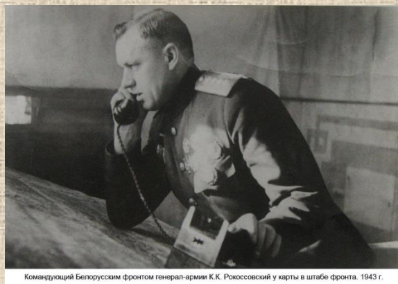
Командующий Белорусским фронтом генерал-армии К.К. Рокоссовский у карты в штабе фронта. 1943 г.