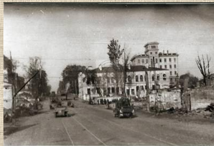
Гомель под оккупацией 1941