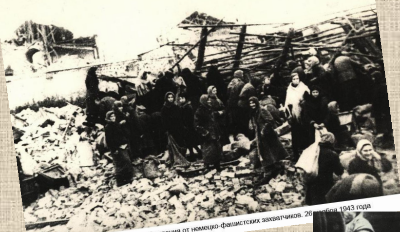
Гомель в первый день освобождения от немецко-фашистских захватчиков. 26 сентября 1943 года

В ходе Гомельско-Речицкой операции отдали свою жизнь 21650 бойцов, командиров, политработников. Не дожили до светлого дня освобождения сотни партизан и подпольщиков, 66556 воинов получили разной степени ранения и контузии.