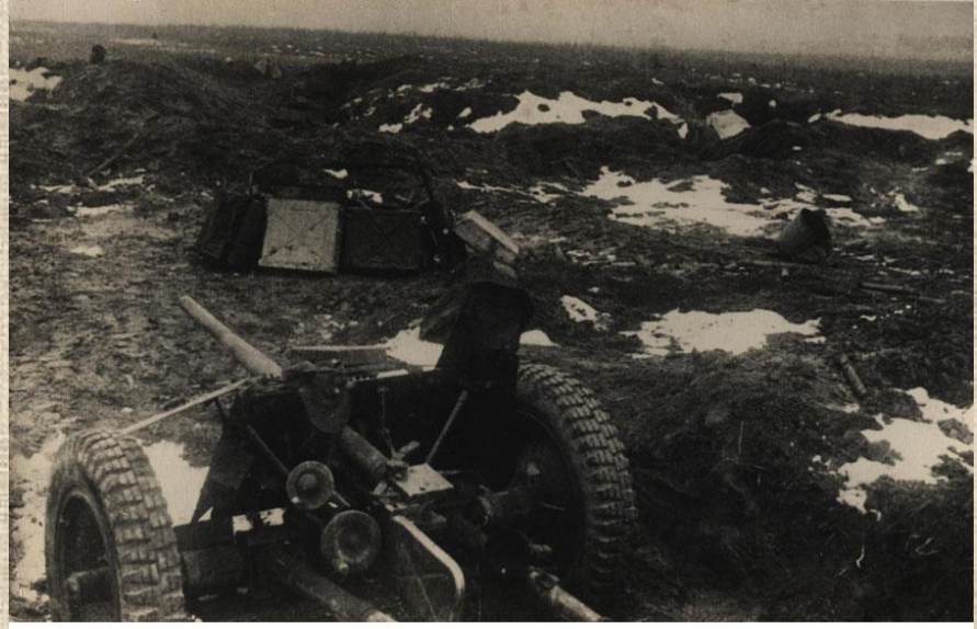
Одна из укрепленных линий противника северо-западнее г. Гомеля, прорванная советскими войсками

Вечером вся страна узнала о новой победе советских войск. 20-ю артиллерийскими залпами из 224-х орудий Москва салютовала доблестным войскам Белорусского фронта, освободившим первый областной центр Беларуси, важнейший узел железных дорог и мощный опорный пункт противника на Полесском направлении.