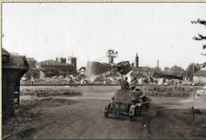
Гомель под оккупацией 1941