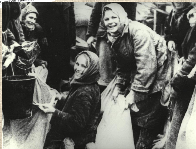
Мы вернулись домой