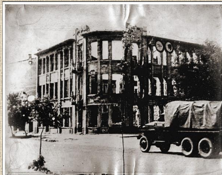
На пересечении улиц Советской и Коммунаров