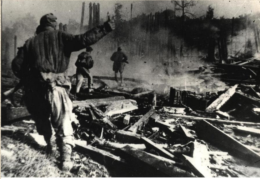
Бои за освобождение Гомеля