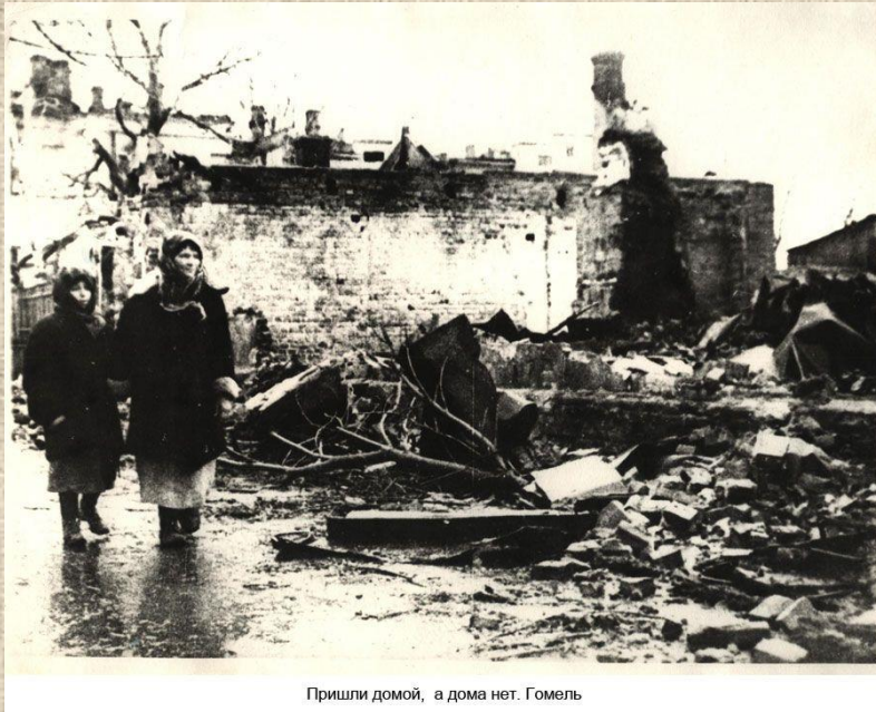
Пришли домой, а дома нет. Гомель

Население освобожденного Гомеля с огромной радостью и слезами на глазах встретило своих освободителей.