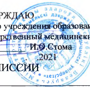
ГРАФИК РАБОТЫ ГОСУДАРСТВЕННОЙ ЭКЗАМЕНАЦИОННОЙ КОМИССИИ специальность «Лечебное дело»