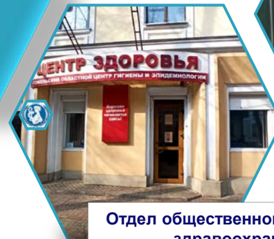
Отдел общественного здоровья и здравоохранения