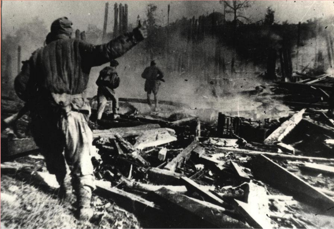
Бои за освобождение Гомеля