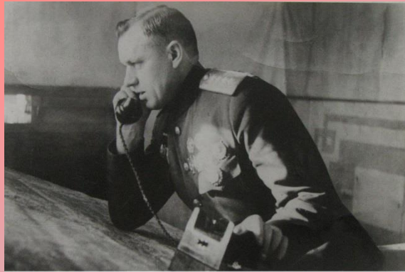
Командующий Белорусским фронтом генерал-армии К.К. Рокоссовский у карты в штабе фронта. 1943 г.

В ночь на 26 ноября части 217-й Унечской стрелковой дивизии полковника Н.П.Масонова и 96-й стрелковой дивизии полковника Ф.Г.Булатова из 11-й армии устремились на северные окраины Гомеля. Одновременно с юго-востока в город ворвались части 4-й Бежицкой стрелковой дивизии полковника Д.Д.Воробьева, 115-го укрепрайона генерал-майора Ф.Ф.Пичугина (11-я армия) и 102-й Дальневосточной Новгород-Северской стрелковой дивизии генерал-майора А.М.Андреева из 48-й армии.