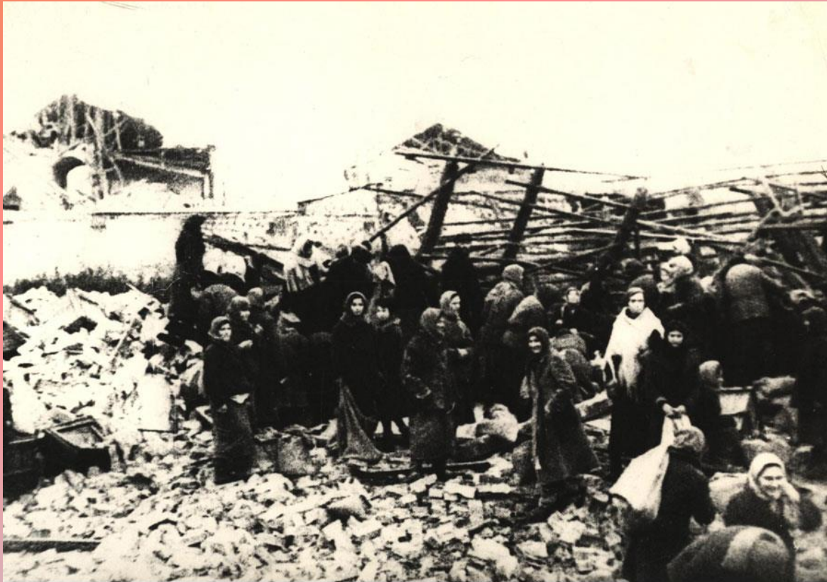
Гомель в первый день освобождения от немецко-фашистских захватчиков. 26 ноября 1943 года

В ходе Гомельско-Речицкой операции отдали свою жизнь 21650 бойцов, командиров, политработников. Не дожили до светлого дня освобождения сотни партизан и подпольщиков, 66556 воинов получили разной степени ранения и контузии.