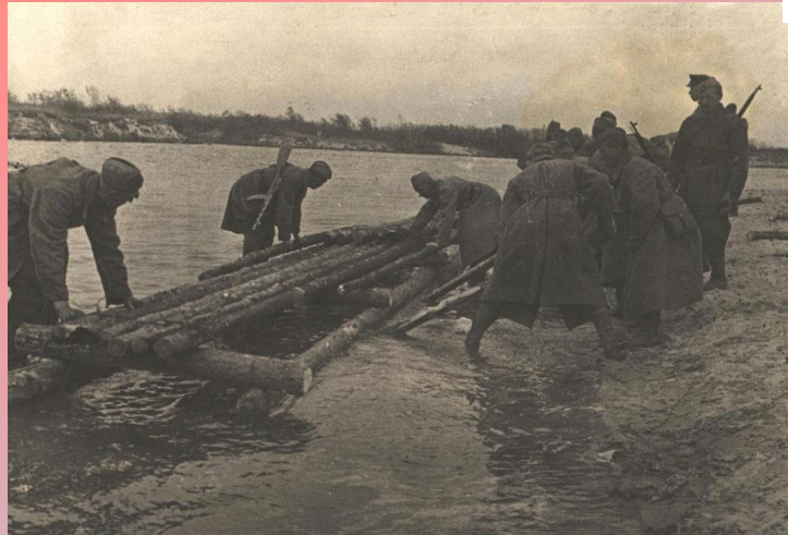
Бойцы сооружают мост через реку Сож

26 ноября 1943г. г.Гомель был освобожден от немецко-фашистских захватчиков.