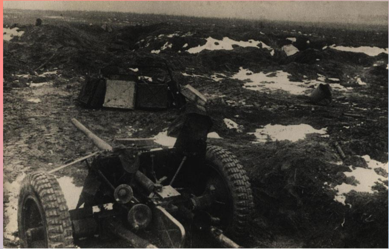
Одна из укрепленных линий противника северо-западнее г. Гомеля, прорванная советскими войсками

Вечером вся страна узнала о новой победе советских войск. 20-ю артиллерийскими залпами из 224-х орудий Москва салютовала доблестным войскам Белорусского фронта, освободившим первый областной центр Беларуси, важнейший узел железных дорог и мощный опорный пункт противника на Полесском направлении.