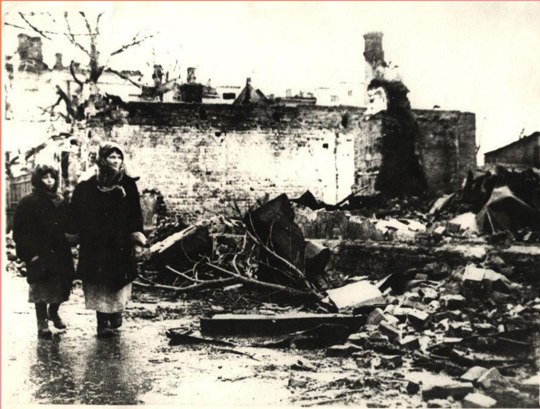
Пришли домой, а дома нет. Гомель

Население освобожденного Гомеля с огромной радостью и слезами на глазах встретило своих освободителей.