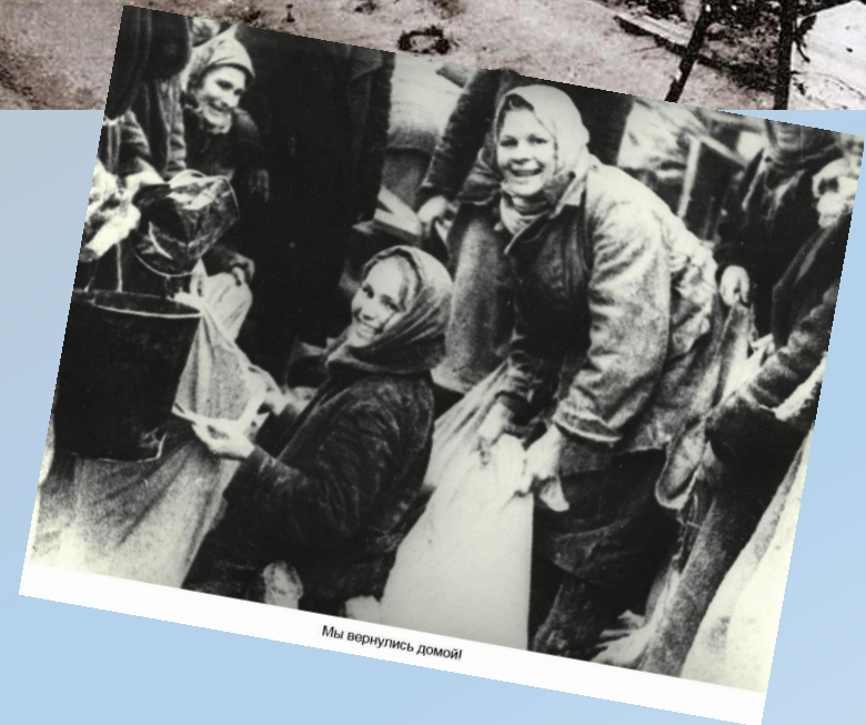
Мы вернулись домой