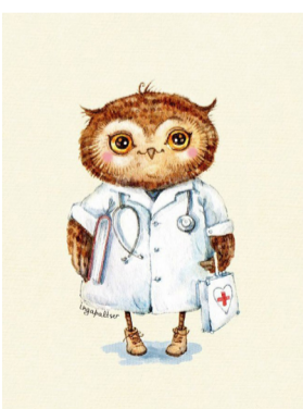
Художник - Инга Пальцер

В 2018 году Всемирный день сна отмечается 16 марта. Итак, что же такое сон и сколько часов мы должны спать? Ученые утверждают, что сон является неотъемлемой частью нашей жизни, ведь именно во сне мы проводим треть своей жизни, а это около 25 лет.