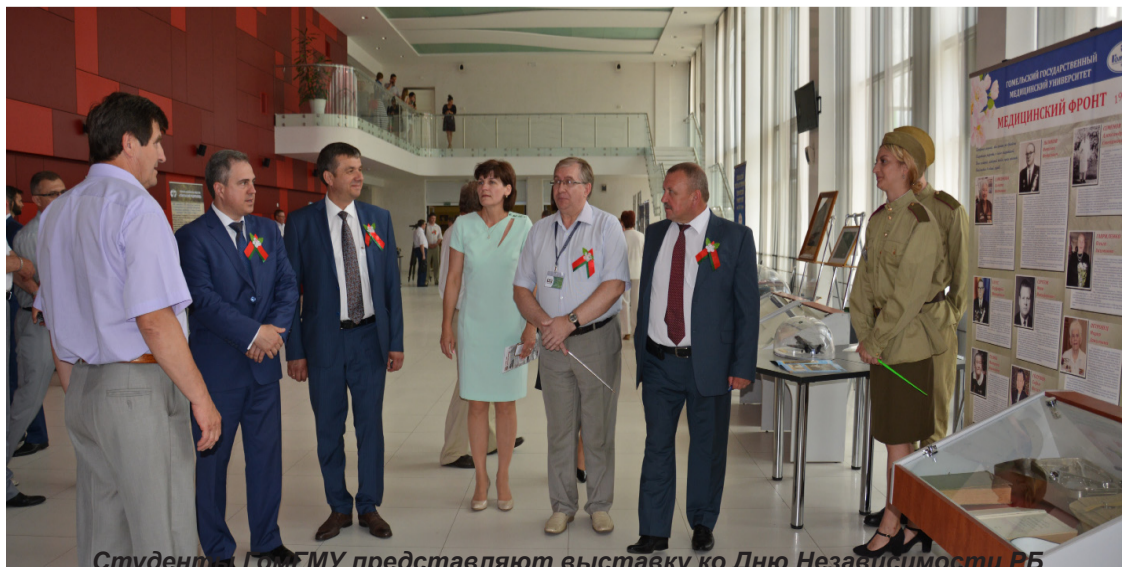
Студенты ГомГМУ представляют выставку ко Дню Независимости РБ

Теперь от нас с вами зависит светлое будущее наших детей и внуков. Пусть и они радуются спокойствию и миру в красивой и суверенной Беларуси!