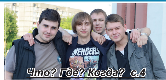
Что? Где? Когда? с.4