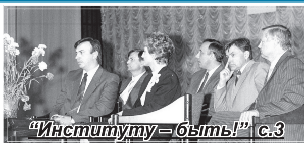
«Институту – быть!» с.3