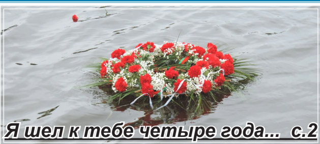
Я шел к тебе четыре года... с.2